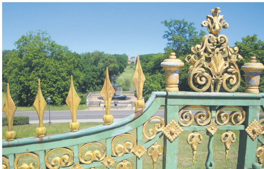
Nutzniessung oder Wohnrecht? – Es muss ja nicht gerade an einem Palast sein...

Die Nutzniessung ist in Art. 745 ff. ZGB geregelt. Sie ist das Recht, gewisse Sachen zu nutzen und zu gebrauchen. Der Nutzniesser kann die Liegenschaft selber bewohnen oder auch vermieten. Die Mietzinseinnahmen gehören dem Nutzniesser. Konsequenterweise muss der Nutzniesser den Eigenmietwert respektive die eingenommenen Mietzinse als Einkommen versteuern. Der Nutzniesser ist nicht Eigentümer der Liegenschaft, er hat kein Verfügungsrecht. Das heisst, dass er das Haus weder verkaufen noch verschenken noch umbauen noch mit Hypotheken belasten kann. Dazu ist einzig der Eigentümer berechtigt. Möchten die Eltern als Nutzniesser beispielsweise bauliche Veränderungen vornehmen, haben sie die Nachkommen als Eigentümer der Liegenschaft zu fragen. Die Nutzniessung kann nicht nur