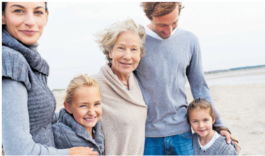
Neues Erbrecht ab 2023

– Den Eltern stand bisher, sofern keine Nachkommen vorhanden sind, ein