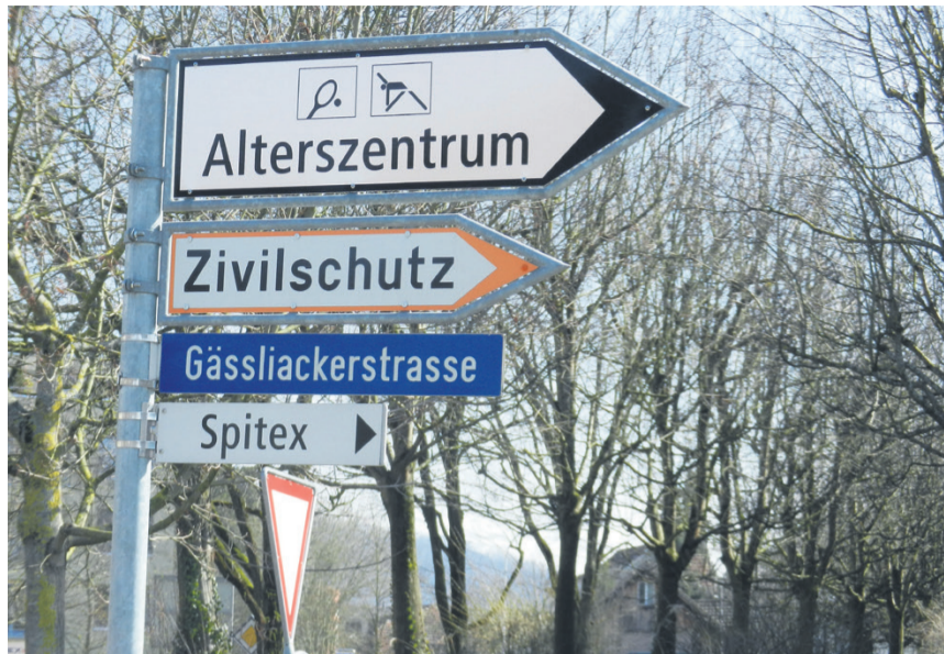
Spitex oder Pflegeheim? – Wer bestimmt dies, wenn Sie urteilsunfähig geworden sind?

Personensorge: Unterbringung, persönliche Betreuung, medizinische Betreuung etc.