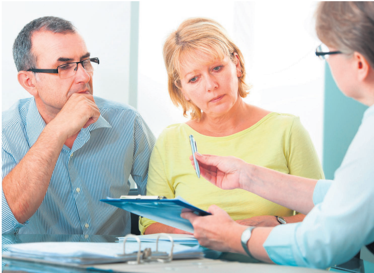
Wer soll für mich Verträge unterzeichnen, wenn ich nicht mehr urteilsfähig bin?

Drei Bereiche können mit Vorsorgeauftrag geregelt werden: die Personensorge, die Vermögenssorge und die Vertretung im Rechtsverkehr. Bei der Personensorge geht es um Fragen der Unterbringung, der Regelung