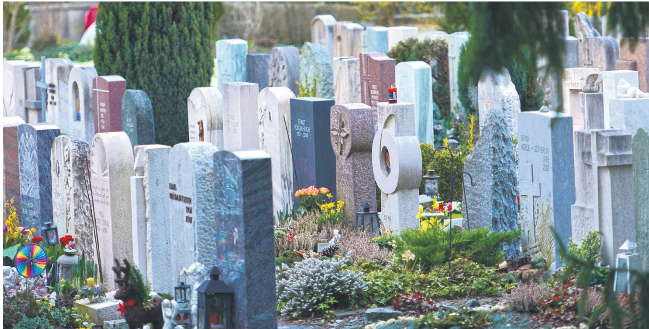
Das Erbrecht ermöglicht, mit einem Testament oder einem Erbvertrag den Nachlass individuell zu regeln.

Wenn jemand keine Verfügung von Todes wegen (Testament oder Erbvertrag) errichtet hat, tritt bei seinem Ableben die gesetzliche Erbfolge ein. D. h., das Erbrecht, das im Schweizerischen Zivilgesetzbuch geregelt ist, bestimmt die gesetzlichen Erben und regelt die Reihenfolge, in der diese zum Zuge kommen. Das Gesetz bestimmt auch, wie viel jeder Erbe bekommt.